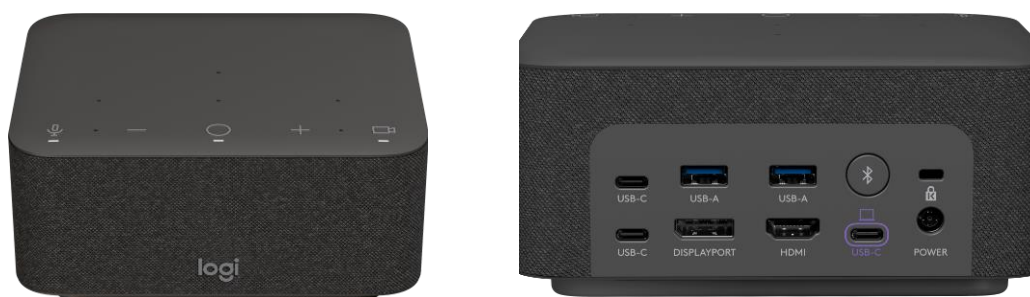
Logi Dock - Parte frontal (I) y parte posterior (D)

Pero a diferencia de las bases en bloque, Logi Dock tiene un aspecto atractivo y moderno (ver las imágenes a continuación) que queda bien incluso en el escritorio del usuario más exigente en casa o en la oficina.