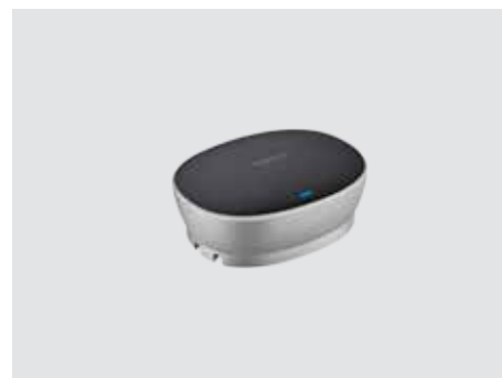
ANSLUTNING OCH ANVÄNDNING

Utöka samtalsområdet räckvidd från 6 meter/20 fot till 8,5 meter/28 fot så att även de som står långt ifrån högtalartelefonen kan höras tydligt. Mikrofoner (säljs parvis) identifieras och konfigureras automatiskt enkelt via anslutning till högtalartelefonen.